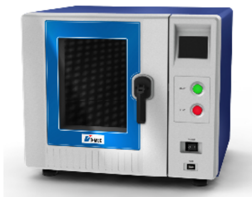
図1 写真；マイクロ波成形機 (Amolsys ®M150)

マイクロ波成形はこれまでなかった全く新しい原理の成形法で、特殊なゴム型の中に微粒状に細かくした熱可塑性樹脂ペレットを充填し、マイクロ波成形機(図1)の中にこのゴム型を置いてマイクロ波でゴム型内の樹脂を溶かす。樹脂はゴム型内のキャビティ形状を転写するので、ゴム型を冷却すれば固化した樹脂成形品を取り出せるという成形法である。図2にマイクロ波成形プロセスを示す。