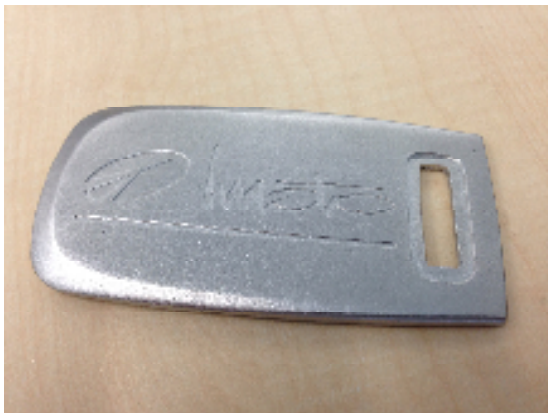
図5 写真；マイクロ波成形で作製した携帯電話カバー（ステンレス製）

金属やセラミックスをバインダーと絡めてペレット状にしたフィードストックを細かくした微粒状のペレットにしてゴム型中に充填し、マイクロ波成形を行うとグリーンパーツが作製できる。このグリーンパーツを脱脂・焼結することによって、金属部品やセラミックスの部品を製造することができる(図5)。やはり、いちいち金型を起こす必要が無いためコストと時間を節約することができ、今後複雑な形状の金属部品やセラミックス部品で少量の量産が必要な用途に適用が広がっていくものと期待している。