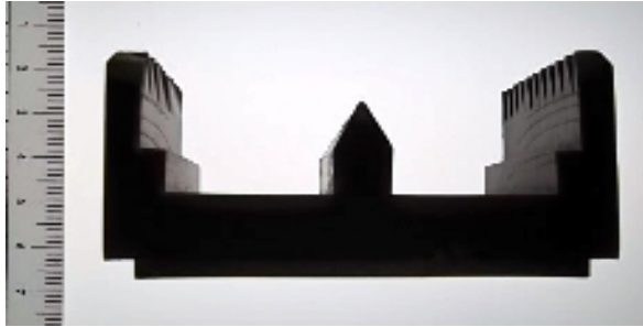
図3 写真；ひけ・反り無しの光成形品 (PP樹脂：肉厚12mm)

金属やセラミックスをバインダーと絡めてペレット状にしたフィードストックを細かくした微粒状のペレットにしてゴム型中に充填し、マイクロ波成形を行うとグリーンパーツが作製できる。このグリーンパーツを脱脂・焼結することによって、金属部品やセラミックスの部品を製造することができる(図5)。やはり、いちいち金型を起こす必要が無いためコストと時間を節約することができ、今後複雑な形状の金属部品やセラミックス部品で少量の量産が必要な用途に適用が広がっていくものと期待している。